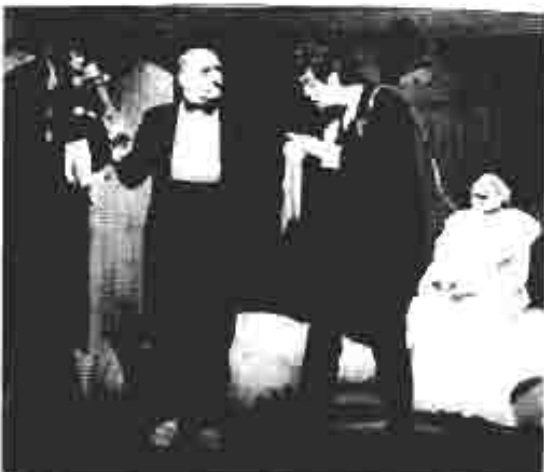
شانۆنامەیی « مۆکینیۆت » لە فۆلک تیاتری شاری رۆستۆک لە ئەلمانیا لە ۲۷-۱۱-۱۹۷۶ دا نمایش کراوە . 3