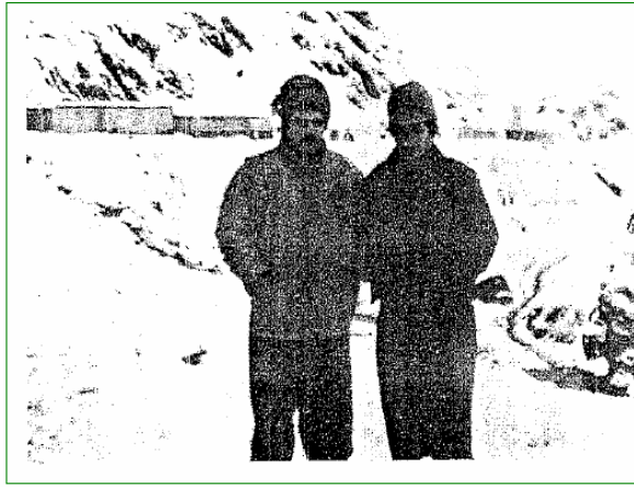
شامیری شه میدان (فاروق جه بار) له گه ل سه روه ری گه ل به ریز (کۆسه رت ره سول سه ل) له باره گای سه رکردایه تی له گوندی (زه لێ) زستانی ۱۹۸۹